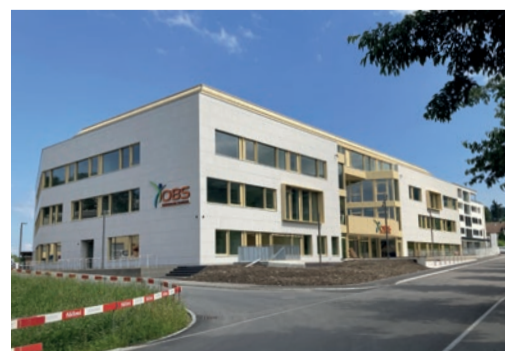
Neubau OBS Campus, Wollerau Privatschule