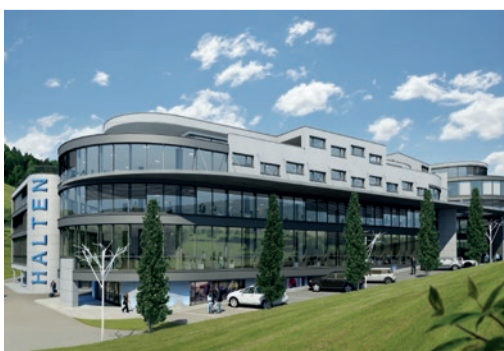
Gewerbebau Halten, Pfäffikon 23 Gewerbeflächen + 1 Wohneinheit