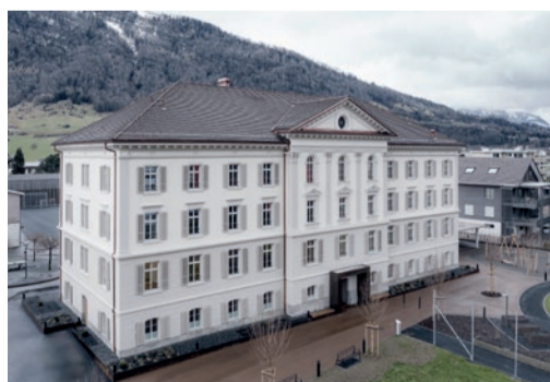
Alterswohnen mit Kindergarten, Arth