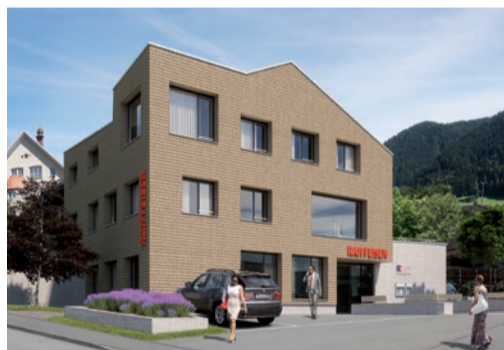
Raiffeisenbank Bürglen Ersatzneubau Bankfiliale Schächental