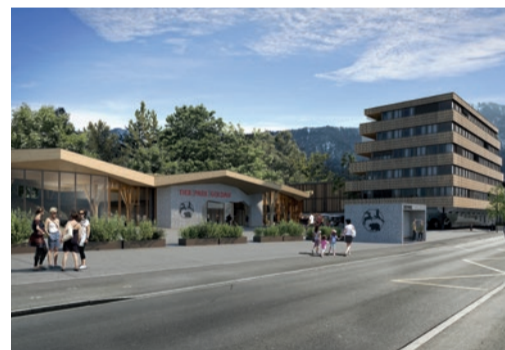
Besucherprojekt und Wohnhaus Natur- und Tierpark Goldau