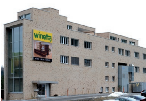
Gewerbebau Zündi, Schindellegi Schreinerei mit Attikawohnung