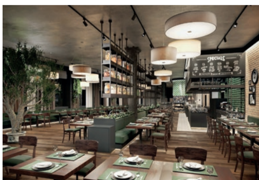
Mieterausbau Doppio Gusto Gewerbebau Halten, Pfäffikon