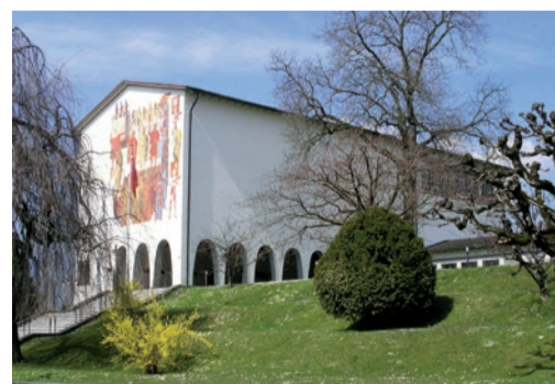
Sanierung Bundesbriefmuseum, Schwyz Neugestaltung gesamtes Museum