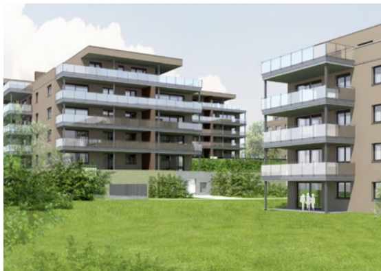
Wohnüberbauung Feld, Seewen 12 MFH mit 171 Wohneinheiten