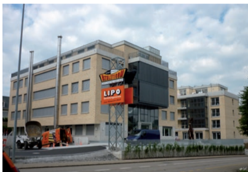
Überbauung Roggenacker, Pfäffikon 1 Wohnhaus (7 Einheiten) + 1 Gewerbehaus (Privatschule)