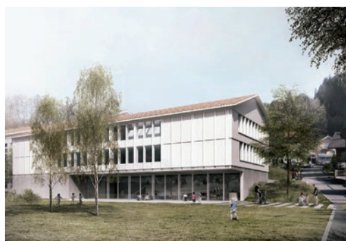
Schule Rothenthurm Erweiterung neuer Schulhaustrakt