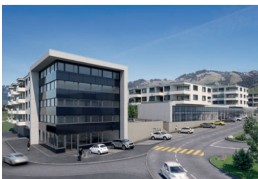
UEBB Fronalp, Ibach 18 Gewerbeeinheiten, 74 Wohneinheiten