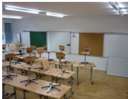
Die Unterrichtsräume im Gewerbehaus