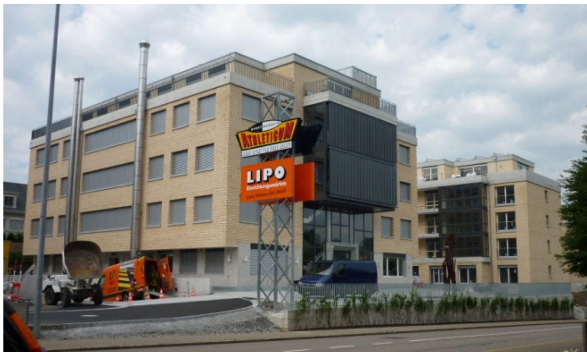
Links das Gewerbehaus und rechts das Wohnhaus

Der Neubau umfasst ein Gewerbehaus und ein Wohnhaus über je 5 Stockwerke mit einer gemeinsamen Tiefgarage mit 150 Parkplätzen welche zusätzlich durch das Gewerbehaus Athleticum genutzt werden. Das Erdgeschoss vom Wohnhaus wird durch eine Kleinkinderbetreuung genutzt. Zudem sind vom 1.OG bis Attika 7 WHG's vorhanden. Das Gewerbehaus wird durch die 2-sprachige Privatschule „Obersee Bilingual School“ genutzt bei welcher 260 Schüler unterrichtet werden.